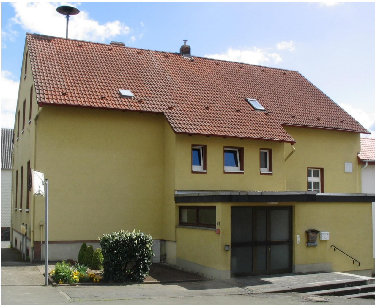
Das Dorfgemeinschaftshaus in Appenrod, © Bick/Stadt Homberg (Ohm)

Eine direkte Busanbindung von Appenrod besteht zur Kernstadt Homberg sowie zum Bahnhof Alsfeld.