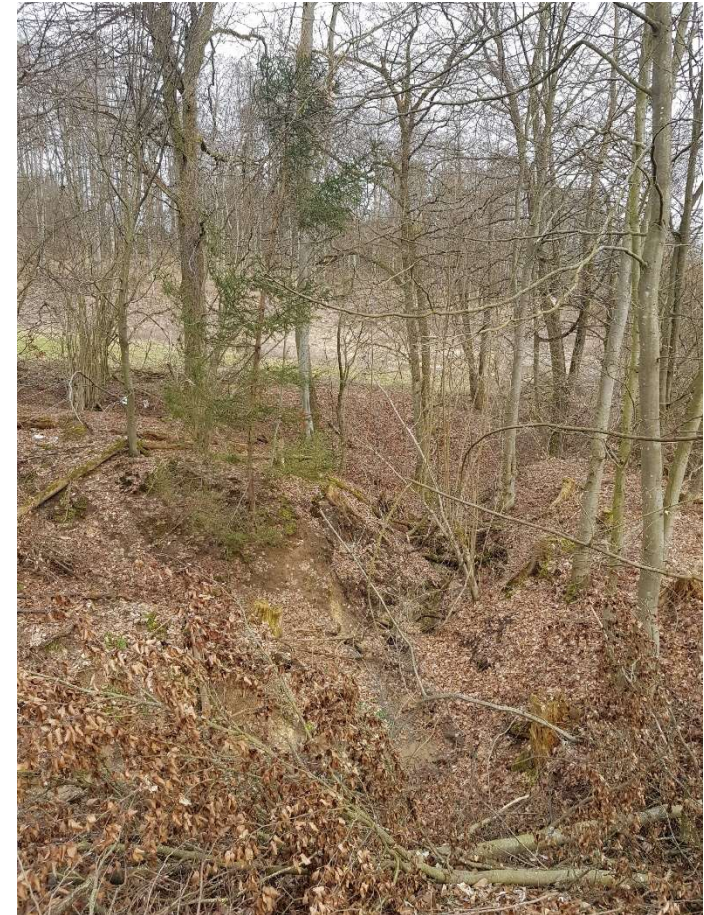
RegioConsult Begehung 21.03.2021