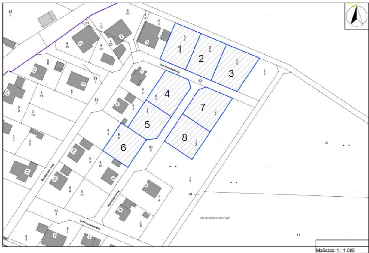
Plan des Baugebiets mit der Lage der einzelnen Bauplätze im Baugebiet