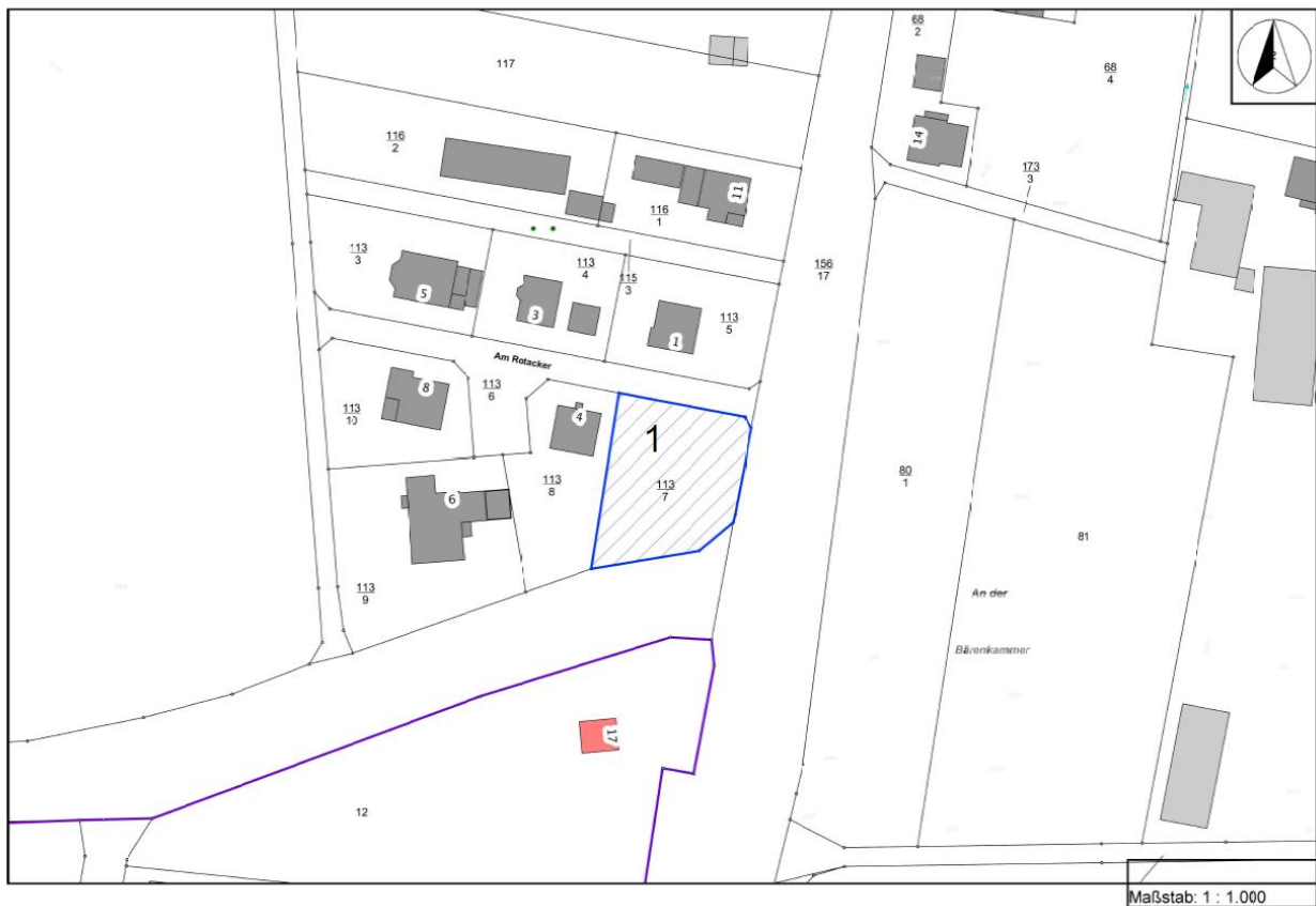
Plan des Baugebiets mit der Lage des einzelnen Bauplatzes