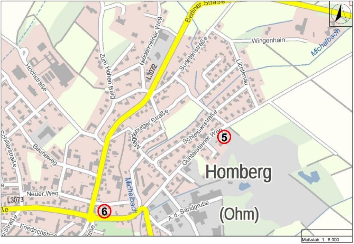
Plan der nördlichen Homberger Kernstadt mit der Lage der privaten Bauplätze 5-6.